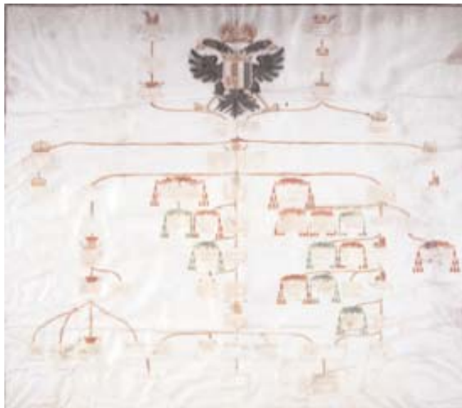
Albero genealogico della Famiglia Corner dei Rami di San Cassiano; San Maurizio e San Polo, penna, pennello e inchiostro colorato su pergamena, 67 x 74 cm., post 1669/ante 1690

Le origini dei Corner sono antichissime, secondo alcuni genealogisti discendono direttamente dalla romana gens Cornelia . Prima di stabilirsi a Venezia pare transitassero per Rimini, in ogni caso sono annoverati tra le più antiche famiglie veneziane. Secondo la tradizione il patriziato veneziano nacque da dodici famiglie "apostoliche" (che avrebbero concorso, nel 697, all'elezione del primo doge: Contarini, Tiepolo, Morosini, Michiel, Badoer, Sanudo, Gradenigo-Dolfìn, Memmo, Valier, Dandolo, Polani e Barozzi) e altre quattro "evangeliche" (Giustinian, Corner, Bragadin e Bembo), cioè