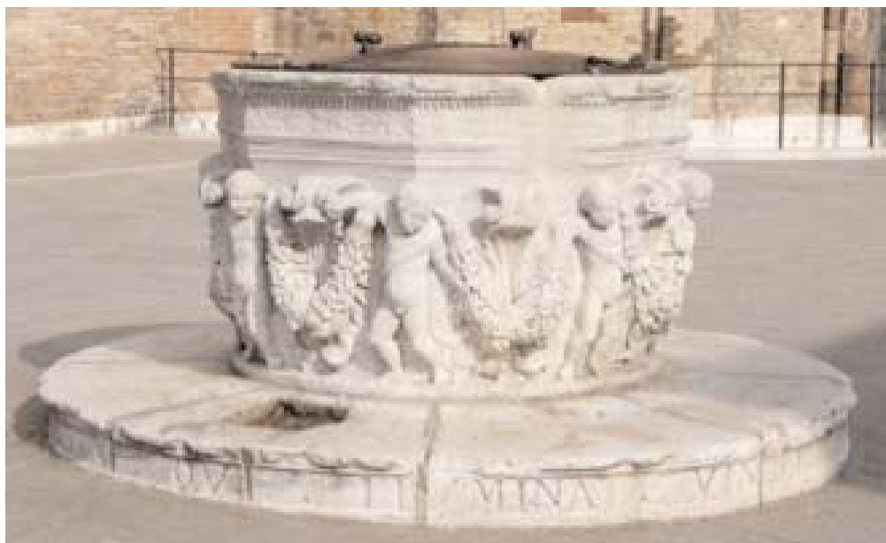
Vera da pozzo in campo SS. Giovanni e Paolo un tempo a Ca' Corner

Nel giardino, sul quale si affaccia la sala consiliare, è collocata una vera da pozzo ricavata da un antico capitello, di provenienza incerta, mentre sulla parete sono infisse due lapidi, una a ricordo del Canova, già menzionata, l'altra con i nominativi a partire dal primo Presidente del Consiglio provinciale (Leopardo Martinengo, 1867-1869) fino a quello del Commissario straordinario Antonio Garione (1926-1929). Sopra la porticina di ingresso al giardino dalla calle laterale è collocata un'antica testa maschile in pietra, forse di epoca romana, molto consunta.