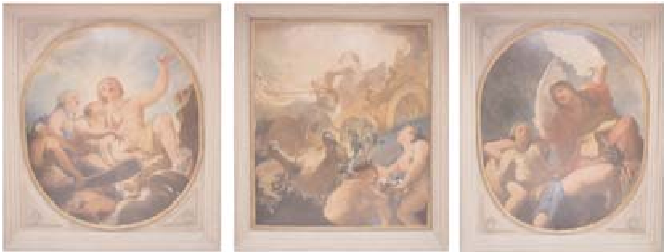
Giovanni Segala, La richiesta di Fetonte al padre di poter condurre il cocchio del sole ( a sinistra ); La caduta di Fetonte nell'Eridanio ( al centro ); Fetonte pianto dalle sorelle Eliadi e dall'amico Cicno nell'atto di trasformarsi in cigno ( a destra ), olio su tela, fine XVII-inizio XVIII secolo

L'autore di questi dipinti, caratterizzati dalla massiccia fisicità dei personaggi che quasi incombono in primo piano facendo trapelare la loro collocazione in epoca tardobarocca, è stato concordemente identificato dalla critica in Giovanni Segala, pittore veneziano apprezzato già dalla critica settecentesca per la "forza e vaghezza dei dipinti suoi" (Zanetti, 1771).