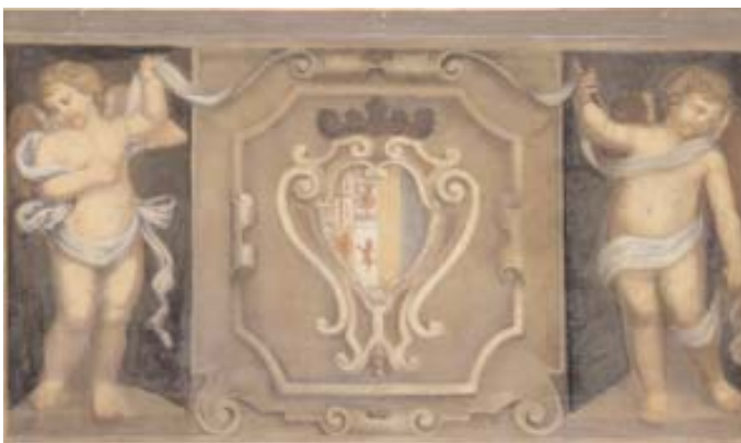
Gruppo veneziano arti decorative (pittore Cesare Mainella?), Due putti con lo stemma dei Corner , olio su tela, 100 x 180 cm ca., 1932