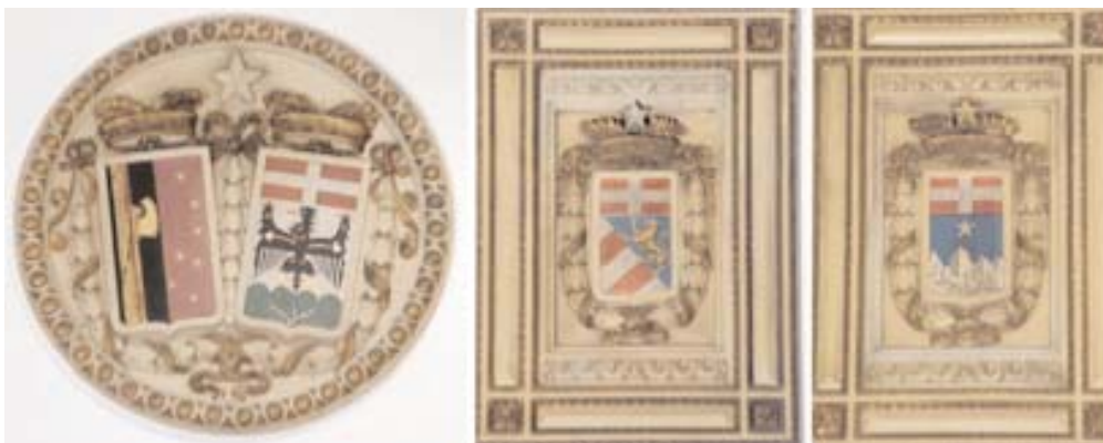
Stemmi delle Province (da sinistra a destra): Quarnaro (Fiume) e Trento; Gorizia; Bolzano