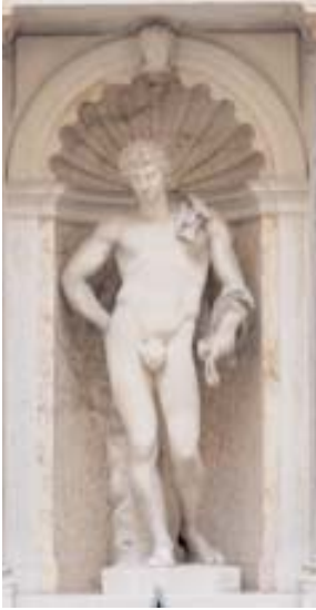
Francesco Cabianca, Antinoo/Hermes, cor- tile, marmo, 1693 ca.

del pezzo, che venne quindi rifiutato; questo fu poi acquistato per Ca' Corner probabilmente da Francesco e oggi collocata nella nicchia del cortile. Poiché si è scoperto che la scultura romana rappresenta in realtà Hermes-Mercurio, anche la statua di Ca' Corner deve essere identificata con tale soggetto, sebbene all'epoca della sua realizzazione fosse comunemente ritenuta la rappresentazione del favorito di Adriano o anche quella di Apollo.