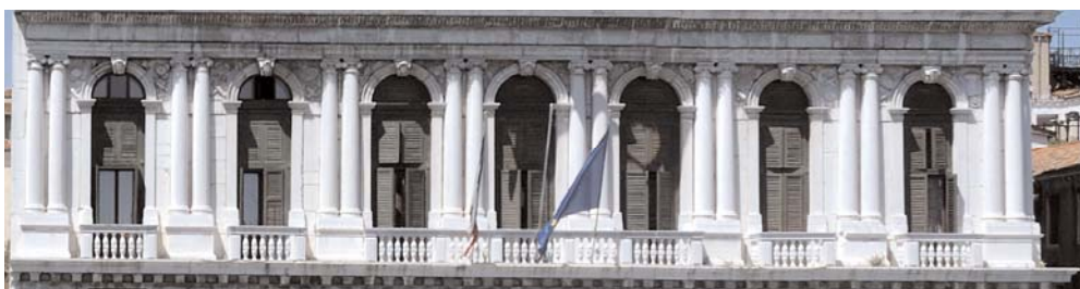
Particolare delle finestre e della balconata centrale