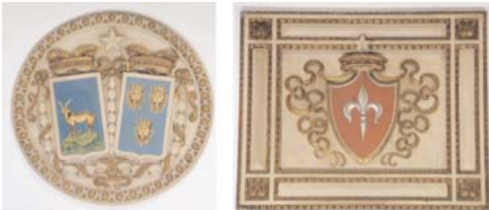
Stemmi delle Province (da sinistra a destra): Pola e Zara; Trieste