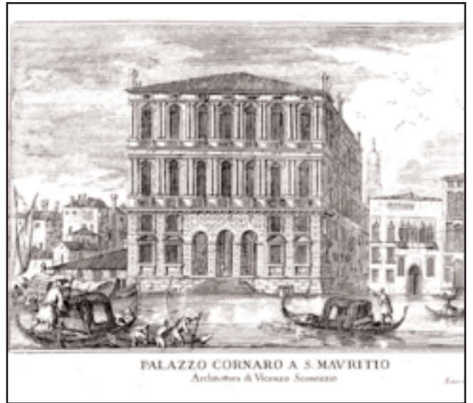
Incisione settecentesca di Luca Carlevarijs con l'erronea attribuzione a Vincenzo Scamozzi. Sulla sinistra l'area dello squero, poi divenuta giardino, e le casette adiacenti.