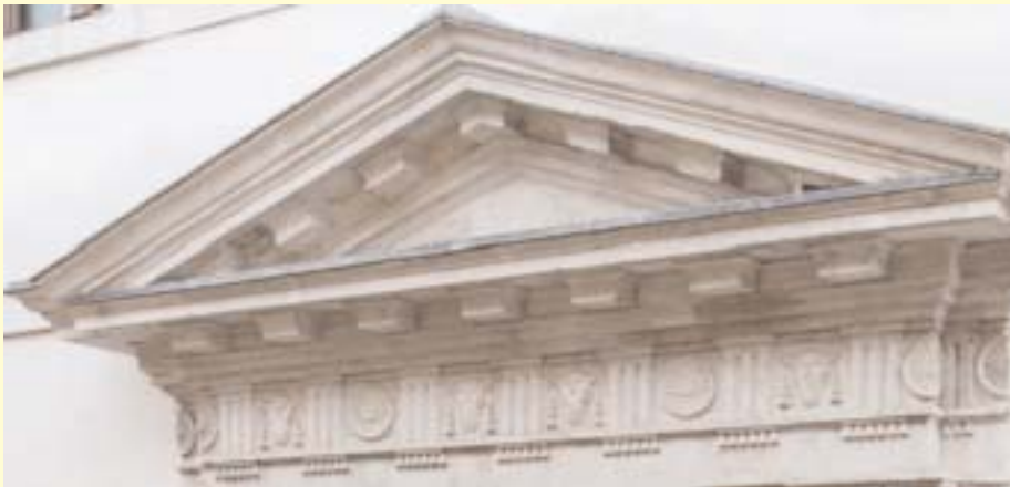
Particolare del portale d'ingresso di terra con il fregio con bucrani

Il fregio di Ca' Corner è simile a quello del parapetto della Rotonda di Arsionoe a Samotracia (oggi nel Museo). La Rotonda è la più grande sala circolare coperta del mondo greco, con i suoi 20 m di diametro. Serviva forse ad accogliere le processioni dei sacri ambasciatori delegati dalle città o dalle associazioni a presenziare alle grandi feste del santuario.