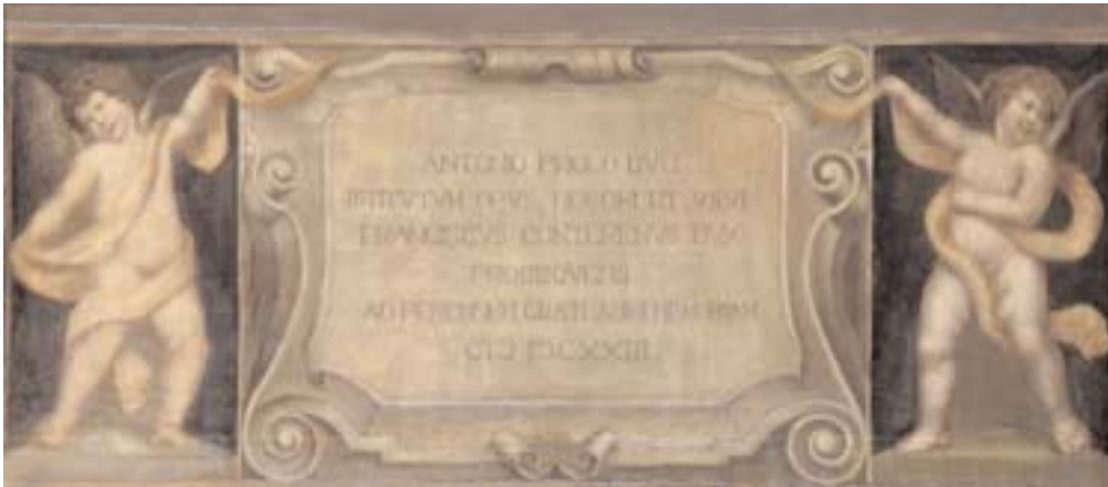
Gruppo veneziano arti decorative (pittore Cesare Mainella?), Copia da Palma il Giovane , olio su tela, 102 x 255 cm ca., 1932

In margine alla delibera n. 12262 del 14 ottobre 1932, per l'approvazione della maggior spesa, si legge che il pittore Angelo Moro richiedeva il pagamento di lavori non preventivati inizialmente, perché, oltre al restauro dei quadri, "si dovette procedere pure alle velature dei due soprafinestre eseguiti dal Mainella e ciò per intonarli all'ambiente, (...)".