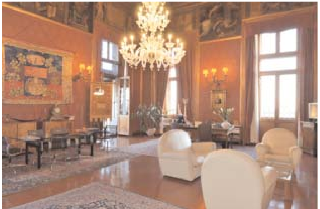
Gabinetto del Sindaco metropolitano, veduta

L'ampia sala che ospita l'ufficio del Sindaco metropolitano (già sede della Presidenza) è ricca di importanti esempi di arte veneziana sia antica che moderna. Entrando nell'ambiente, attira subito l'attenzione la tavola fondo oro con la Madonna con Bambino , risalente forse tra il XV e il XVI secolo e attribuita in via dubitativa alla scuola veneziana dei Vivarini, inserita in una cornice in stile rinascimentale, probabilmente ottocentesca. La tavola, realizzata come una icona, è già citata come appartenente alla scuola dei Vivarini in un documento del 1869 rinvenuto nell'Archivio provinciale, relativo ad un intervento di restauro con ripristino della doratura, dove viene definita "Quadro rappresentante la Beata Vergine nella sala delle sedute della Deputazione provinciale".