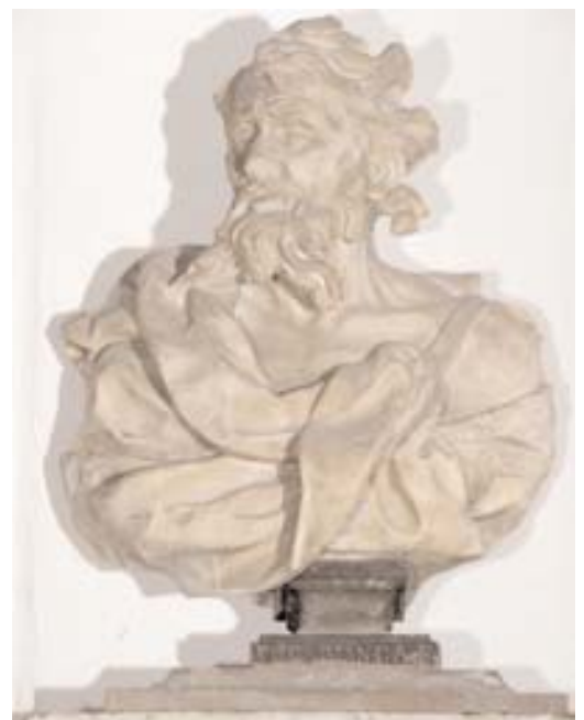
Francesco Cabianca, Busto virile, cortile. Marmo, 1716-20 ca.

Negli spazi del pianterreno è collocata una serie di 13 Busti virili e femminili , di cui uno reca la firma "F.co Cabianca", che probabilmente risale alla committenza dei Corner. Sicuramente la famiglia apprezzava questo artista, visto che a lui si devono anche gli stucchi dell'alcova, attribuitigli già nel Settecento da Tommaso Temanza (vedi pp. 55-56), e anche il fratello Bortolo lavorava per i Corner del ramo di San Cassiano eseguendo gli stucchi nella Villa Cornaro a Piombino Dese (1716-1720).