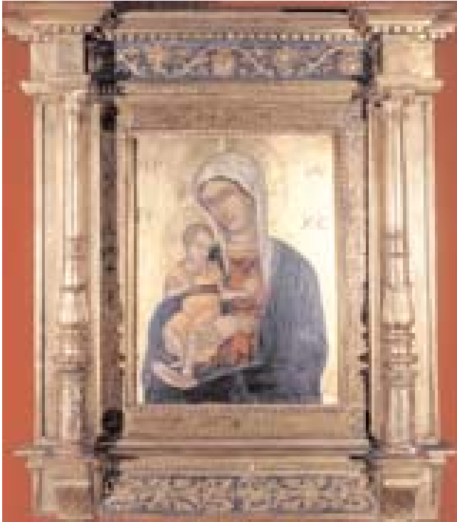
Scuola dei Vivarini (?), Madonna con bambino “ Odighitria ”, Olio su ta- vola, cm 45 x 35, tra il XV e il XVI sec.

A fianco della scrivania è collocato il gonfalone della Provincia di Venezia, così descritto da Antonio Stangherlin nel libro La Provincia di Venezia 1797–1968 nel 50° anniversario della vittoria (Venezia, 1968): “Venne istituito con deliberazione del Rettorato il 26 dicembre 1936 in sostituzione del vecchio deteriorato dal tempo. Opera finissima eseguita dal laboratorio femminile del Comitato provinciale orfani di guerra. Su fondo rosso laborato da pregevoli arabeschi d’oro, inquadrato dagli stemmi seguenti: nel mezzo, lo stemma della provincia col leone marciano; sul lato destro, dagli stemmi di San Donà di Piave, di Chioggia, di Noale, di Mirano, di Dolo e di Concordia Sagittaria; sul lato sinistro, dagli stemmi dei comuni di Portogruaro, di Cavarzere, di Caorle, di Malamocco e di Jesolo; sopra, al centro, dallo stemma del comune di Venezia; sotto, al centro, dallo stemma del comune di Mestre”.