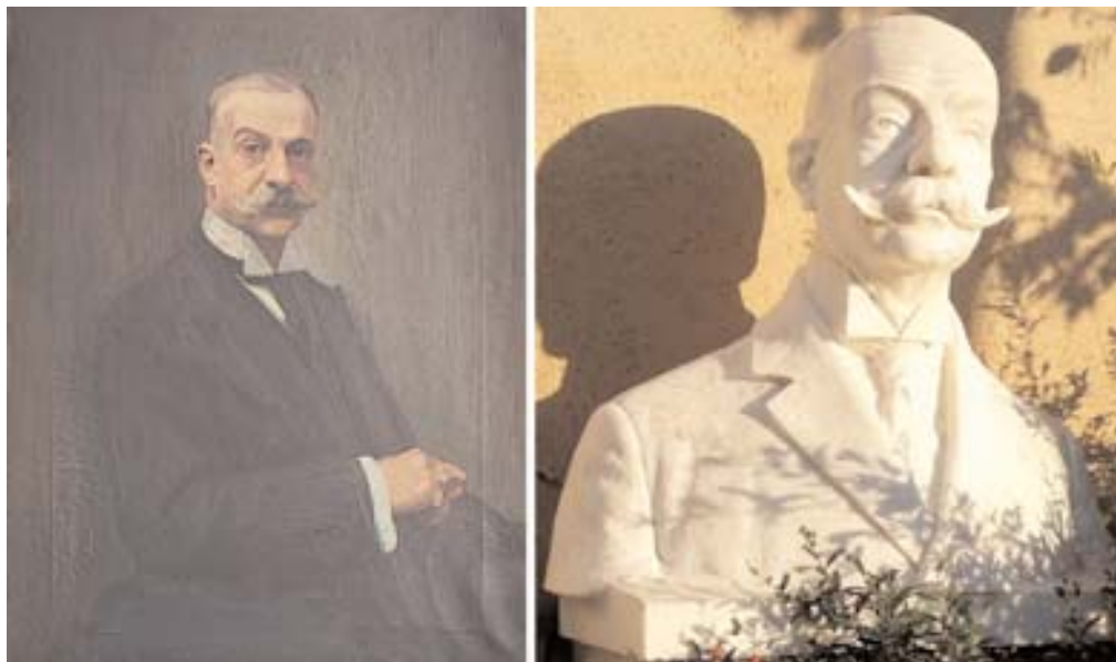
Umberto Zini (?), Ritratto di Filippo Grimani (a sinistra) Anonimo, Busto ritratto di Filippo Grimani, marmo (a destra)

è stato identificato in Umberto Zini, secondo quanto riscontrato nei documenti conservati nell'archivio provinciale.