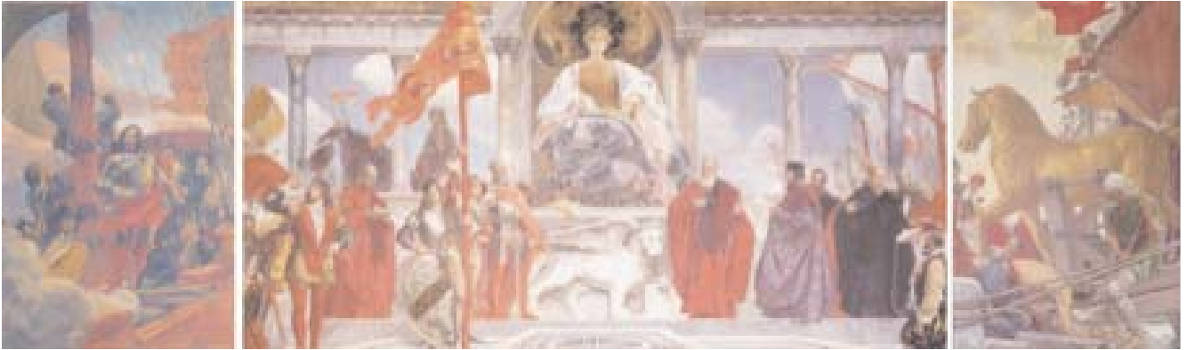
Vittorio Emanuele Bressanin, a sinistra: Una nave capitana, seicentesca, in piena battaglia , olio su tela, 390 x 257 cm, 1911; al centro: Venezia gloriosa per la sua sapienza civile e politica , olio su tela, 390 x 700 cm, 1911; a destra: Tributo d'arte: le navi apportanti a Venezia da Costantinopoli i cavalli d'oro per la basilica , olio su tela, 390 x 257 cm, 1909-10

blica del Leone. Tra i personaggi rappresentati troviamo il condottiero Bartolomeo Colleoni (1395/1400-1475), l'eroe della battaglia di Lepanto e doge Sebastiano Venier (1496 circa – 1578), nonché il maestro della pittura veneziana del Cinquecento Tiziano Vecellio, e poi senatori, ammiragli di terra e di mare, sbandieratori e soldati, trombettieri e scrivani, alabardieri e spadaccini, patriarchi e procuratori.