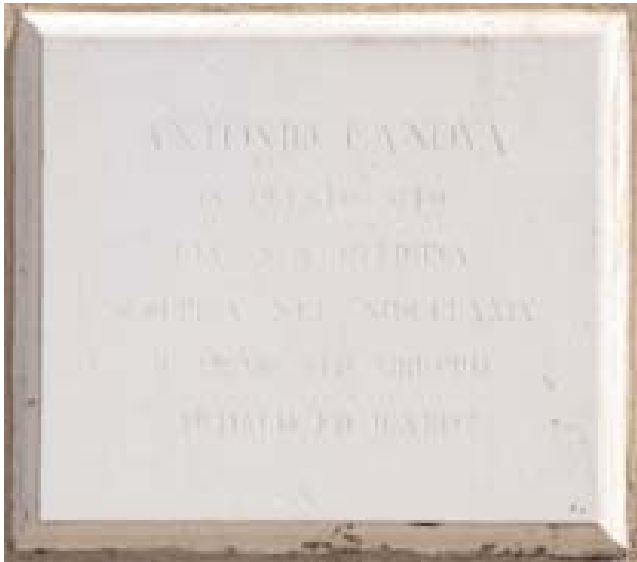
Lastra in marmo con iscrizione a memoria della realizzazione del gruppo scultoreo Dedalo e Icaro da parte di Antonio Canova nell'area del giardino di Ca' Corner