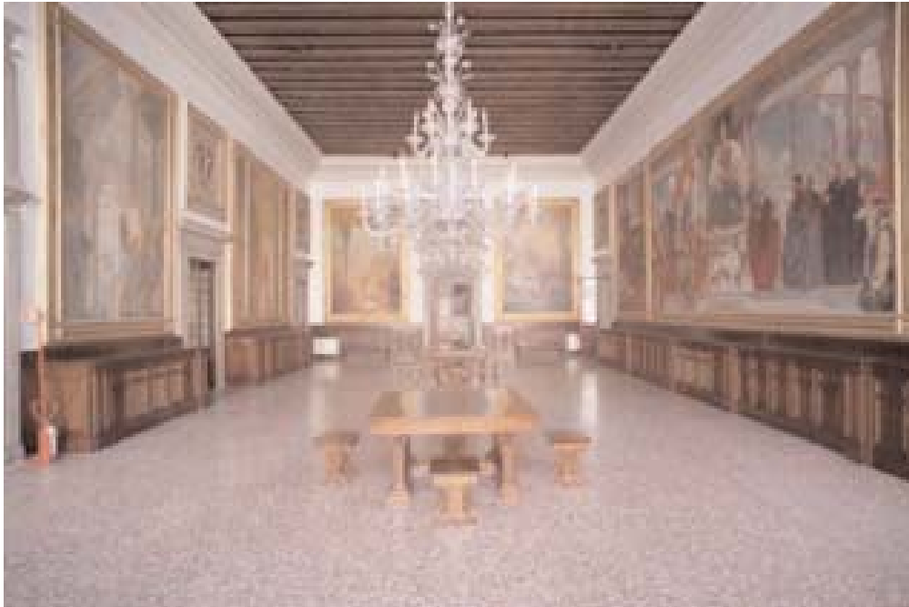
Il salone, veduta generale

stata scelta quale “segno del dominio veneto e della civiltà latina”. Il lato posteriore, invece, prendeva spunto dalla Torre dell’Orologio di Piazza San Marco. Di grande interesse era l’intero complesso espositivo, qui ci soffermiamo solo sulla sala “della Gloria”, una delle quattro sale riservate a Venezia, in quanto erano qui esposti i 7 “teleri”. Questa sala era posta al piano superiore della Loggia, destinato a sala di rappresentanza e di manifestazioni, pertanto i committenti curarono in particolare i soggetti delle opere che dovevano mantenere “vivi quei legami formali e “contenutistici” che caratterizzarono l’antica tradizione artistica della Serenissima, e che, peraltro, l’Italia avrebbe ereditato”.