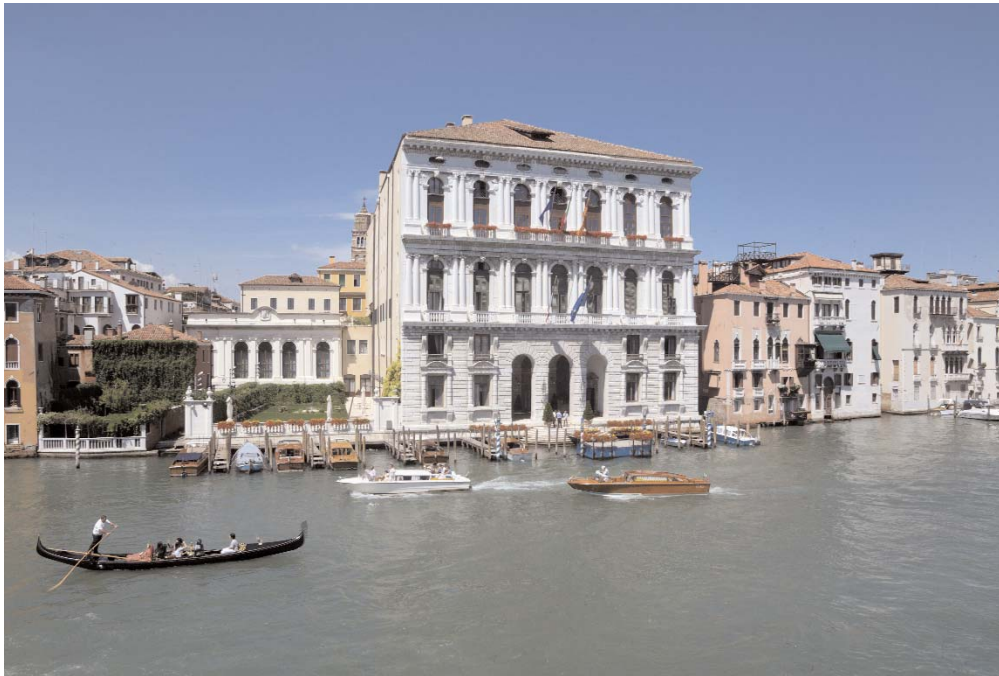
Vista di Ca' Corner la Ca', Granda del giardino e della sala consiliare