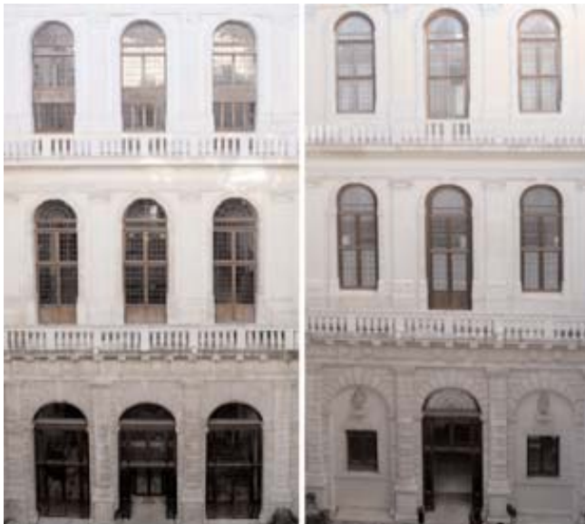
Facciate sul cortile