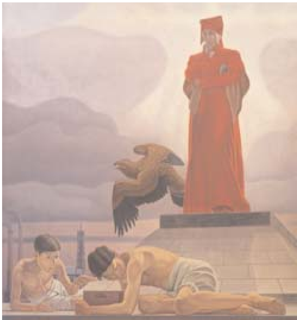
Cagnaccio di San Pietro, Il trionfo dello spirito sulla materia , olio su compensato, 61 x 55 cm, 1935-1936

Prima di accedere al salone del quarto piano (o secondo piano nobile), si transita per il vestibolo dove è esposta una delle rare opere realizzate su commissione della Provincia. Si tratta de Il trionfo dello spirito sulla materia: 18 novembre 1935 , dipinto dall'artista veneziano Cagnaccio di San Pietro.