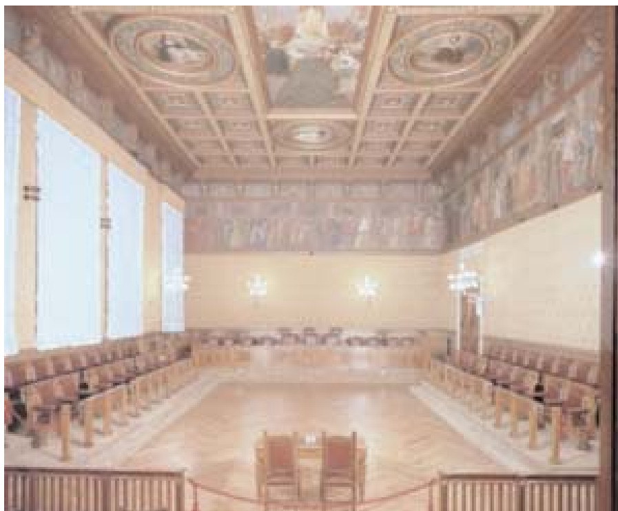
Sala del Consiglio, interno