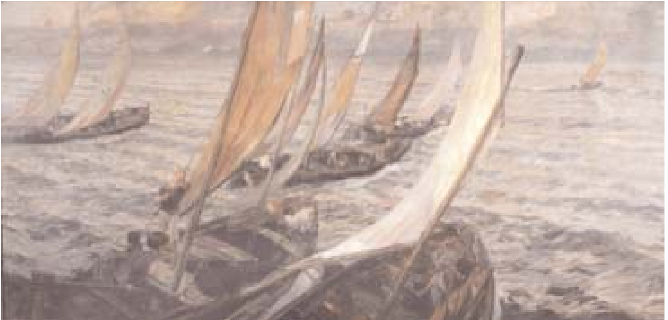
Ettore Tito, Partenza per la pesca , olio su tela, 161 x 335 cm, 1909.

Paesaggi lagunari sono presenti anche in opere di varia provenienza quali Sul mare di Angelo Brombo (1936), La poesia di un'ora di Dario Galimberti (1936), L'isola di San Giorgio di Virgilio Guidi (1960), Prospettiva di Burano (1972) e Laguna veneziana (1985) di Carlo Memo. Mentre tra le opere dei giovani talenti veneziani non si può non citare Situazione n. 4 (1962) di Arabella Giorgi, prematuramente scomparsa nel 1973.