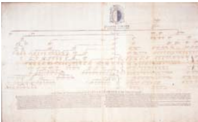
Anonimo XVII secolo (?), Punto del testamento del N.H. Zuane Corner MCCCXLVIII , stampa, pennello e inchiostro colorato su carta pergamena, 50 x 82 cm

I due stemmi li ritroviamo anche sotto il ritratto del doge Marco Corner (dal quale, come già rilevato, discendono i tre rami di San Maurizio, San Polo e San Cassiano), l'altro presente in un dipinto collocato nel Gabinetto del Sindaco metropolitano, sotto a quelli degli altri 3 dogi Corner (appartenenti alla linea di San Polo).