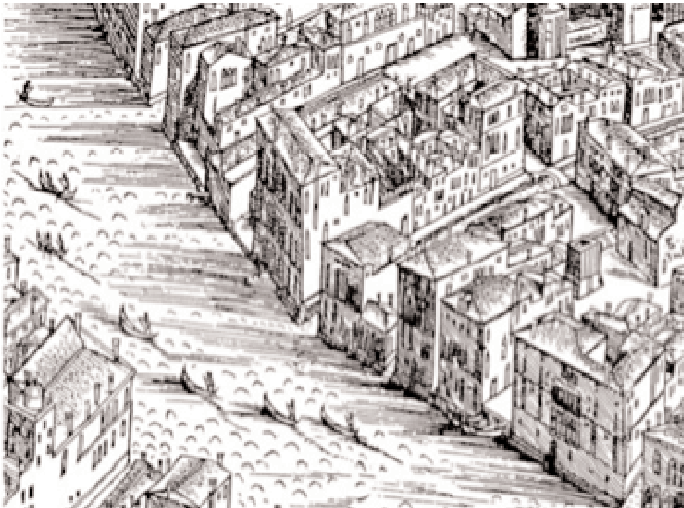
Pianta di Jacopo de Barbari (1500), particolare

Le vicende degli ultimi Corner di San Maurizio tra il Settecento e l'Ottocento, sono indagate in uno studio ancora in divenire, proposto in Appendice .