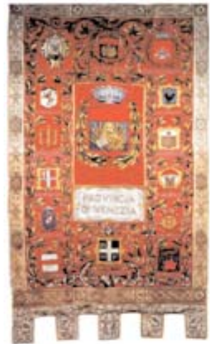
Gonfalone della Provincia di Venezia

Un dipinto che costituisce una interessante testimonianza storica della famiglia Corner è l’albero genealogico De gente cornelia , databile tra il 1697 e il 1709: lo si deduce dalla presenza di Giorgio, figlio di Federico, creato cardinale da Innocenzo XII nel 1697, data che figura nel cartiglio che a lui si riferisce, e rappresentato indossante la porpora. Il fratello Giovanni II, che fu il 111° doge, fu invece eletto nel 1709. L’opera è pervenuta nelle collezioni dell’Amministra-