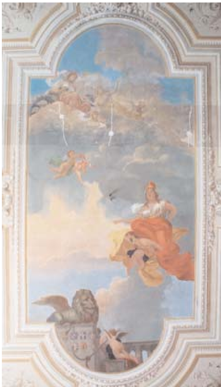
Lorenzo Rizzi (attr.) Venezia trionfante sulle nubi con gli stemmi dei 7 Comuni distrettuali dipinto murale, ca. 840/890 x 605/620 cm con quadratura, tra 1866 e 1893

A lato dell'androne dell'accesso d'acqua del palazzo, tra questo e il giardino, si trova la sala detta degli Affreschi, poiché il soffitto è interamente decorato da dipinti murali databili entro il 1893. Al centro del soffitto, incorniciata da un fregio polilobato che simula stucchi è dipinta la raffigurazione di Venezia trionfante sulle nubi con gli stemmi dei 7 Comuni distrettuali . Lo stile adottato dall'artista richiama i grandi soffitti affrescati del Tiepolo: la figura femminile che incarna Venezia, in testa il corno dogale, posta al centro della composizione, è retta da putti e da vaporose colonne di nubi.