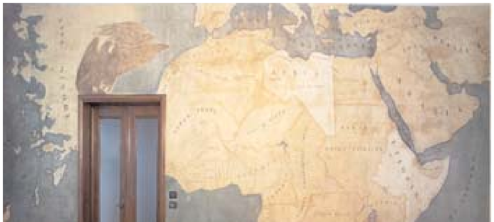
Sala delle carte geografiche, particolare della parete di ingresso

Non possiamo dimenticare una stanza davvero peculiare situata in quello che è chiamato il "palazzo nuovo", edificato nel 1938 a nord del Palazzo provinciale quale ampliamento della sede degli uffici e della Prefettura di Ca' Corner: si tratta della cosiddetta "Sala delle carte geografiche", non aperta generalmente al pubblico per la difficoltà di accesso. Si tratta di un ambiente le cui pareti sono interamente occupate da carte geografiche affrescate su di esse.