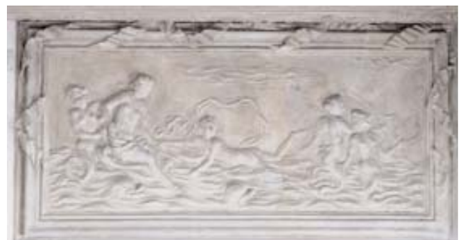
Francesco Cabianca (attr.), in alto Galatea (?), in basso Venere, stucco, 1716-20 ca.