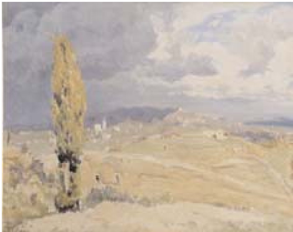
Teodoro Wolf Ferrari, Verso Asolo e il Montello , olio su compensato, 56 x 74 cm; datato 28 marzo 1924

Completa l'arredo un olio di Teodoro Wolf Ferrari (Venezia 1876–San Zenone degli Ezzelini/Treviso 1945), intitolato Verso Asolo e il Montello , quadro esposto alla XIV Esposizione Internazionale d'Arte di Venezia, acquistato dalla Provincia nel maggio del 1924.