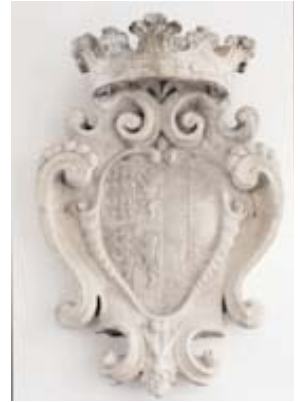
Stemma dei Corner infisso alla parete del- l'androne

Sempre sulla parete sinistra sono disposti gli stemmi dei 44 Comuni, ovvero il territorio metropolitano così come è configurato oggi, commissionati nel 2004 al Maestro Dario Dall'Olio, che li ha realizzati in bronzo con la tecnica della cera persa. Del Comune di Cavallino Treporti, istituito nel 1999 dopo la divisione dal Comune di Venezia, vi è solo la targa con il nome mentre manca lo stemma, poiché al momento della commissione l'insegna comunale non era ancora stata approvata.