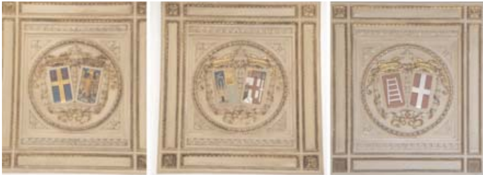
Stemmi delle Province (da sinistra a destra): Belluno e Udine; Rovigo (stemma del Comune, in mancanza di quello della Provincia) e Padova; Verona e Vicenza